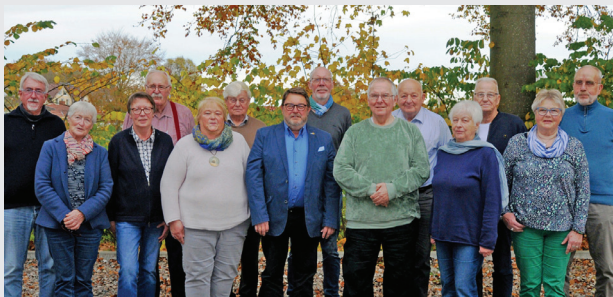
(Die Mitglieder der Gründungsversammlung im Oktober 2022)

Der Kreissenienerrat Schleswig-Flensburg e. V. ist ein Zusammenschluss von kommunalen Seniorenbeiräten aus dem Kreis Schleswig-Flensburg. Er ist in das Vereinsregister eingetragen und vom Finanzamt als gemeinnützig anerkannt. Gegründet wurde der Kreissenienerrat Schleswig-Flensburg e. V. im Oktober 2022 mit dem Ziel, die Altenhilfe zu fördern.